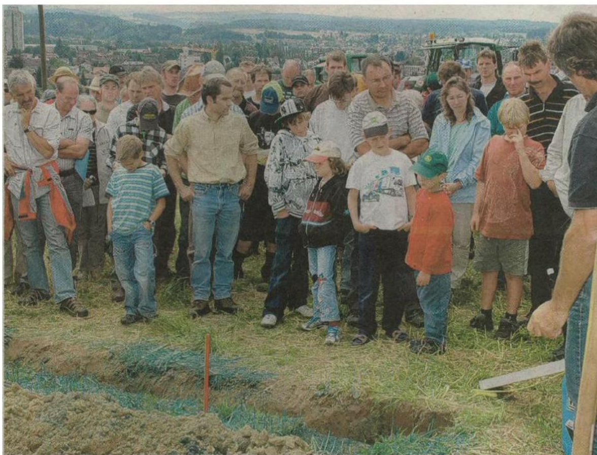
Die Kursbesucher beurteilen den Zustand des Bodengefüges.