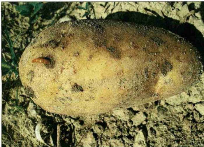
Der Drahtwurm ist ein robustes Wesen.