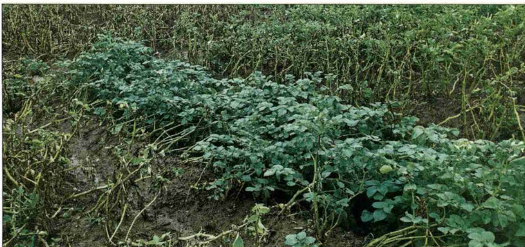
Grosse Unterschiede: Die gegen Krautfäule resistente Sorte Vitabella und ihre anfälligen Nachbarinnen. (Bild hd,