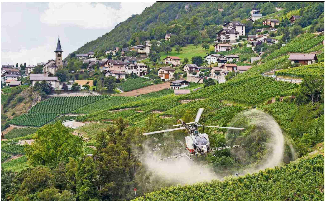
Im Weinbau sollen Pestizide dosierter versprüht werden. Hier ein Helikopter über einem Rebberg oberhalb von Siders VS.