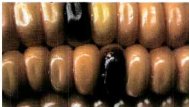
Mit Mais, der blaue Körner weitervererbt, wird im NFP 59 die Auskreuzung der Maispollen grossflächig untersucht.

Ständerat dürften es die Gentech-Gegner noch schwieriger haben. Damit ein Gesetz beschlossen wird, braucht es aber die Zustimmung beider Räte. Falls sich das Parlament gegen ein Verbot von Gentech in der Schweizer Landwirtschaft entscheiden sollte, stehen dem gentech-kritischen Lager noch zwei Möglichkeiten offen: Eine Ständesinitiative und eine Volksinitiative. Hier würde Maya Graf einer Ständesinitiative den Vorrang geben. Eine Volksinitiative zu