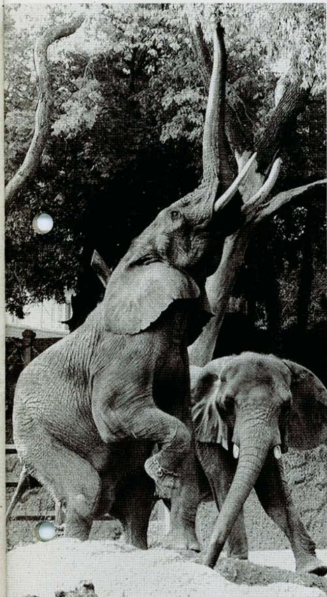
Stosszähne des Elefanten: Als Zwischenstufe nicht mehr ganz Zahn, noch nicht Horn? Wülste, wie als Anlage für Hörner, finden sich jedenfalls am Elefantenschädel.

Schädel des indischen Elefanten sind die Wülste gerade dort, wo bei der Kuh das Horn angewachsen wäre. Indessen sind die Stosszähne klein und beim weiblichen Tier kaum ausgebildet. Der afrikanische