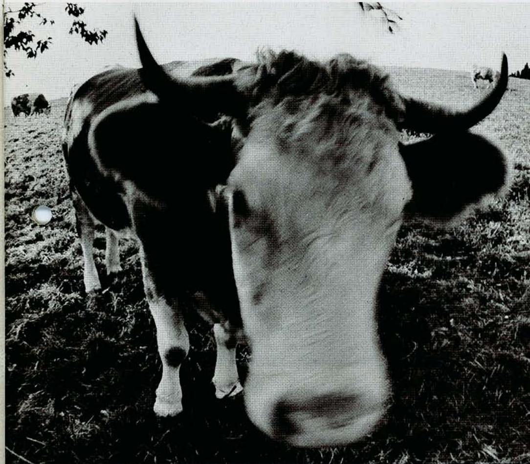
Von der Schönheit ihres Kopfschmucks hat die Kuh noch nicht gelebt. Die Hörner haben auch einen Zusammenhang mit der Verdauung.

minder wertlose Ausstülpungen, die man, je nach Standpunkt, einmal als Schmuck, einmal als Waffe betrachten könne.