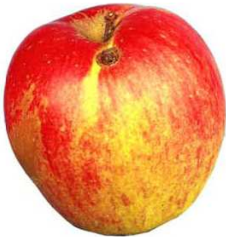
Beispiel 1: Vernarbte Fasztelle

Maximal 2 cm 2 , gut vernarbt, Fruchtform wenig beeinträchtigt.