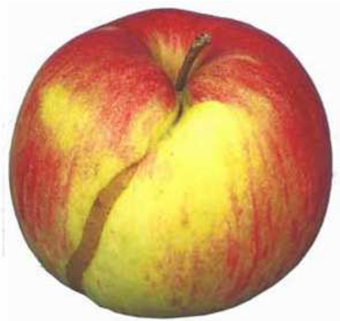
Beispiel 2: Vernarbte Fassstelle