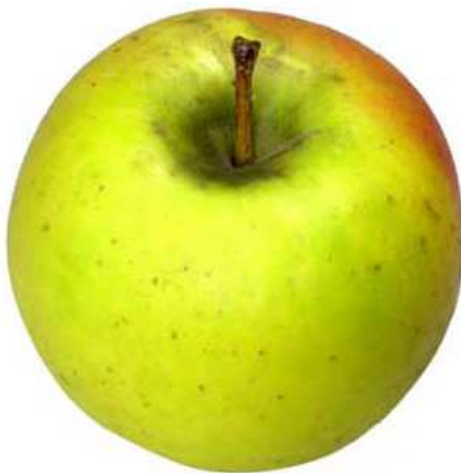
Beispiel 1: Regenflecken in der Stielgrube