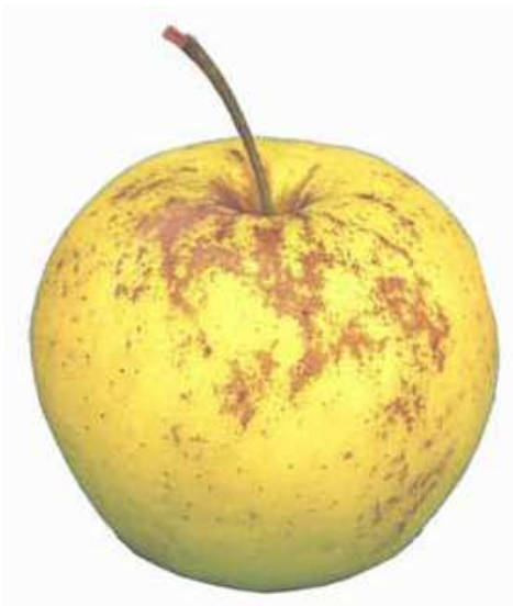
Beispiel 1: Nicht sortentypische Berostung