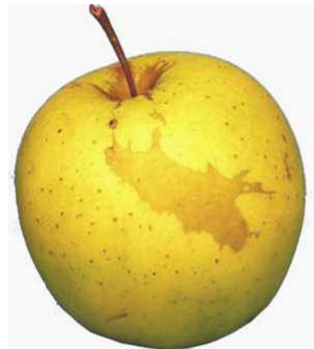
Beispiel 2: Kompakte Berostung