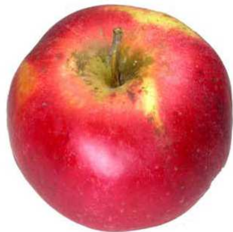
Beispiel 2: Regenflecken in der Stielgrube und Ausserhalb auf rotem Untergrund