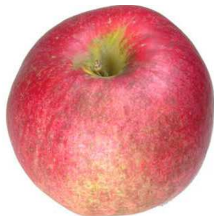
Beispiel 4: Regenflecken, Russtau auf dunklem Grund