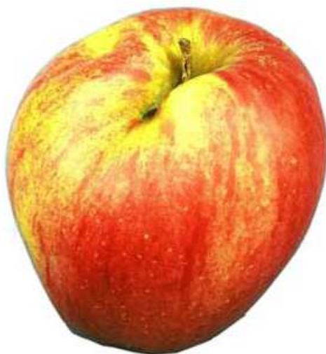
Beispiel 3: Vernarbte Stichstelle