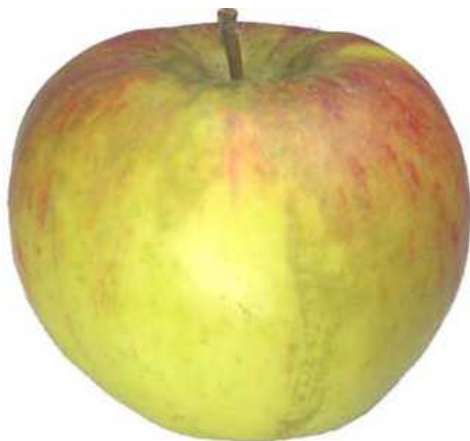
Beispiel 3: Russtau auf hellem Grund