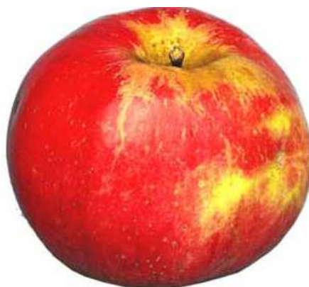
Beispiel 3: Verteilte, fein genetzte Berostung