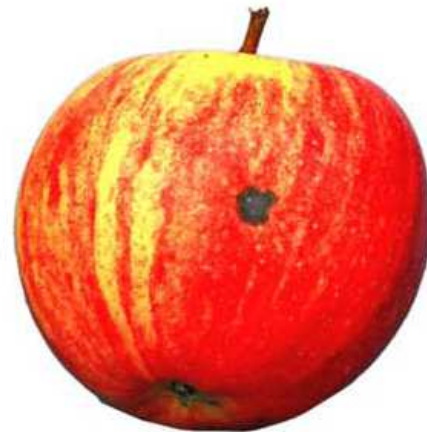
Beispiel 2: Schalenflecken auf dunkler Schale