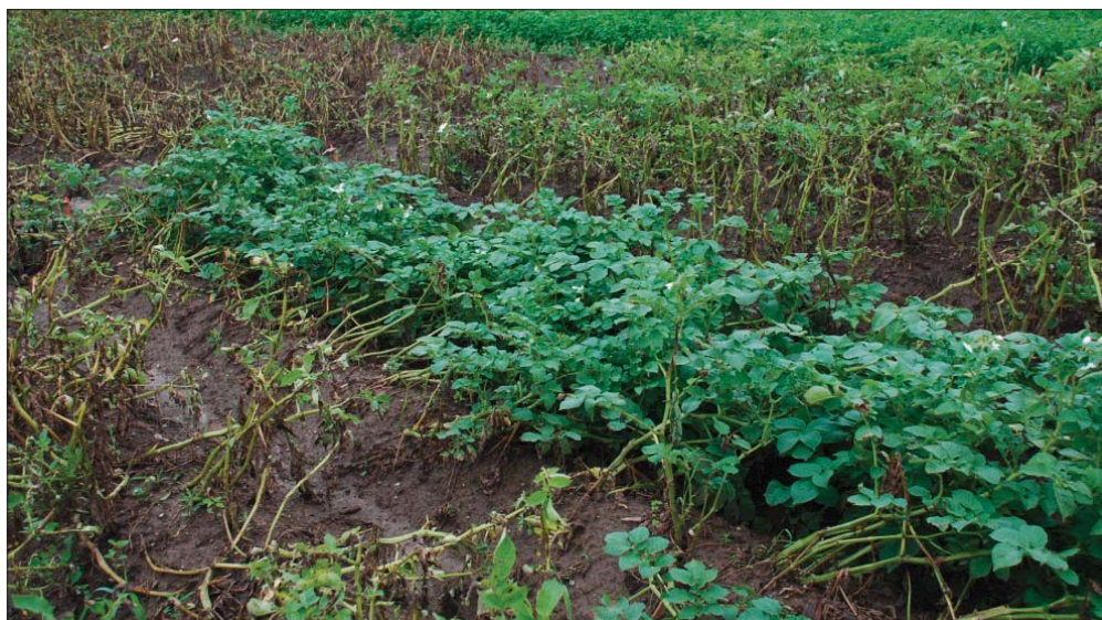
Eine krautfäuletolerante Sorte umgeben von anfälligen Kartoffelsorten.

Zwei wichtige Neuentwicklungen gab es vor 10 Jahren: Mit den Sorten Naturella und Appell schien der Durchbruch gegen die Krautfäule gelungen. Doch die Euphorie hielt nur wenige Jahre an. Appell war zwar sehr tolerant gegenüber der Krautfäule, sie bildete aber viele, eher kleine, ovale Knollen mit glatter, heller Schale. Die Krautentwicklung und damit die Unkrautunterdrückung war schwach. Ein weiterer Nachteil war ihre Empfindlichkeit auf Pulverschorf. Bei Naturella war