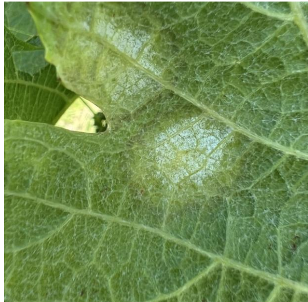
Frische Ölflecke des Falschen Mehltaus (Bild links) mit Sporulation auf der Blattunterseite (Bild rechts).

Mit den Niederschlägen vom vergangenen Wochenende sollten vorhandene Ölflecke jetzt sporulieren und daher deutlich zu sehen sein. Eine Kontrolle lohnt sich auf jeden Fall.