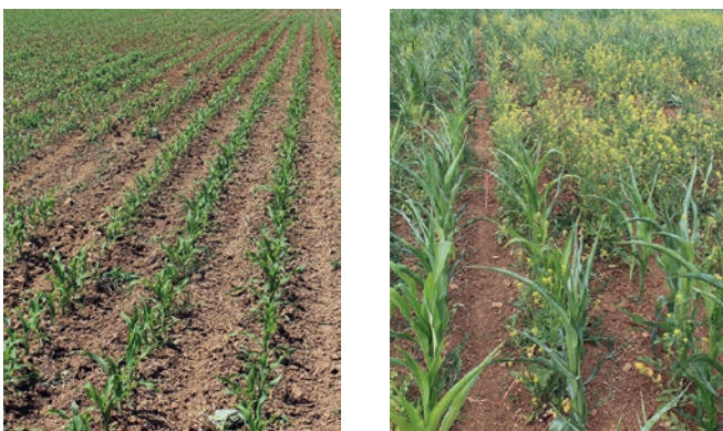
Abb. 5: Links Bestandslücken in einer Parzelle mit Fehlstellen. Die Pflanzen wurden in den zwei Reihen, die von der Kamera erfasst werden, auf 2 m Länge entfernt. Rechts eine Parzelle mit Senfeinsaat zur Simulation von Verunkrautung.

Zusammenfassend zeigte sich, dass die Kamerasteuerung bei entsprechenden Einsatzbedingungen eine starke Steigerung der Fahrgeschwindigkeit auf über 10 km/h ermöglicht und sich diese hohen Geschwindigkeiten auch kontinuierlich bei hoher Arbeitsqualität halten lassen.