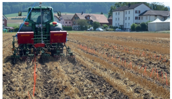
Abb. 6: Mit dem maschinenseitig vorgegebenen Abstand von 25 cm zwischen den Hackwerkzeugen blieben alle Markierungsstöcke stehen, keiner wurde herausgehackt.

Gegenüber sensorbasierten Steuerungen eines Querverschieberahmens hat der Einsatz satellitenbasierter Traktorlenksysteme zudem den Vorteil, dass sie für weitere Arbeitsgänge bei Saat, Pflege und Ernte eingesetzt werden können und dadurch eine höhere Gesamtauslastung des Systems wie auch Fahrerentlastung resultiert.