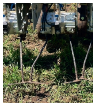
Abb. 3: Hacken innerhalb der Pflanzenreihen. Links der Garford-In-Row-Weeder, rechts der Poulsen-Robovator.