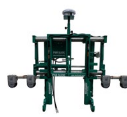
Abb. 4: Ultraschallbasiertes Regelsystem, links an der Hacke, rechts am Querverschieberahmen.