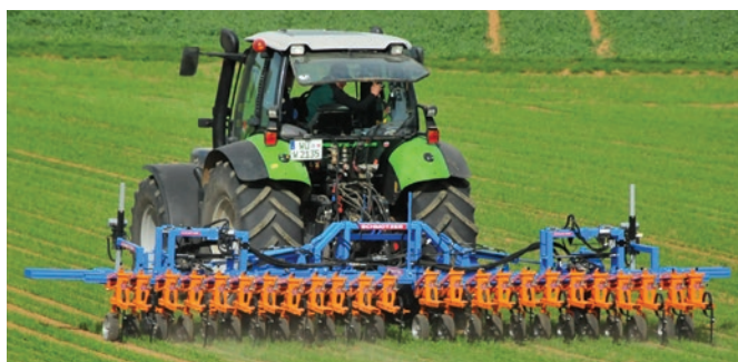
Abb. 2: Mit einzelnen Kameras separat angesteuerte Hackfelder für das Hacken über mehrere Säarbeitsbreiten hinweg.

Im Gegensatz zur manuellen Steuerung können mittels mehrerer Kameras mehrere Säarbeitsbreiten gleichzeitig gehackt werden (Abb. 2).