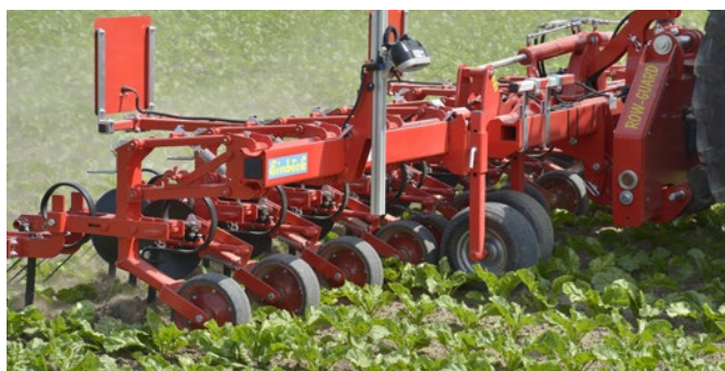
Abb. 1: Die Kamera detektiert zwei Pflanzenreihen und steuert den Querverschieberahmen dynamisch nach.