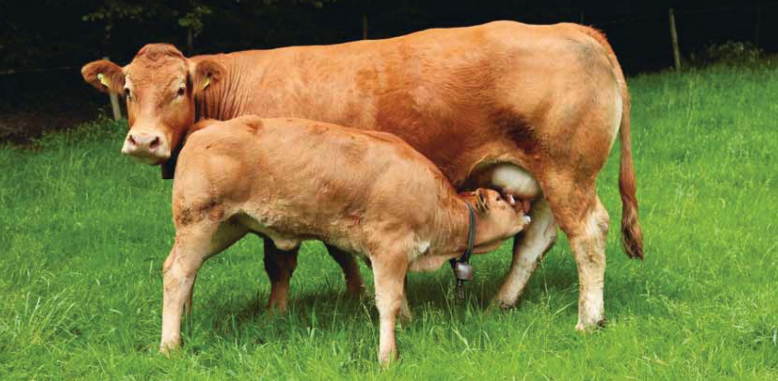
Natura-Beef-Tiere in Bioqualität lösen auf dem Markt einen Zuschlag von Fr. 60.–

Bio umsteigen, könnten die eigentliche Umstellung dann im Idealfall innerhalb von wenigen Monaten vollziehen. «Während die neu gekauften Mutterkühe im Sommer bereits auf den Weiden grasen,