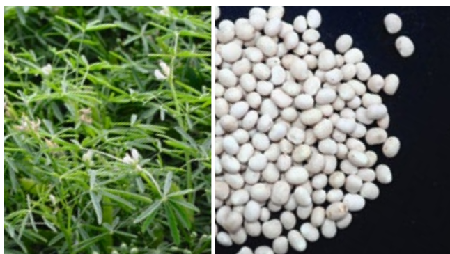
Schmalblättrige Lupinen eignen sich für den Anbau in Rein- und Mischkultur. Die Samen sind kugelförmig.