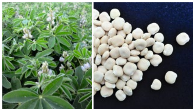
Weisse Lupinen eignen sich für den Anbau in Reinkultur. Die Samen sind flache Scheiben.

darfsgerecht produziert werden kann.» Da die Forschenden noch keinen Mischungspartner gefunden haben, der gegenüber der Reinkultur besser wäre, muss jedoch leider noch mit Spätverunkrautung aufgrund der langen Reifezeit der Weissen Lupine bis mindestens Mitte August gerechnet werden.