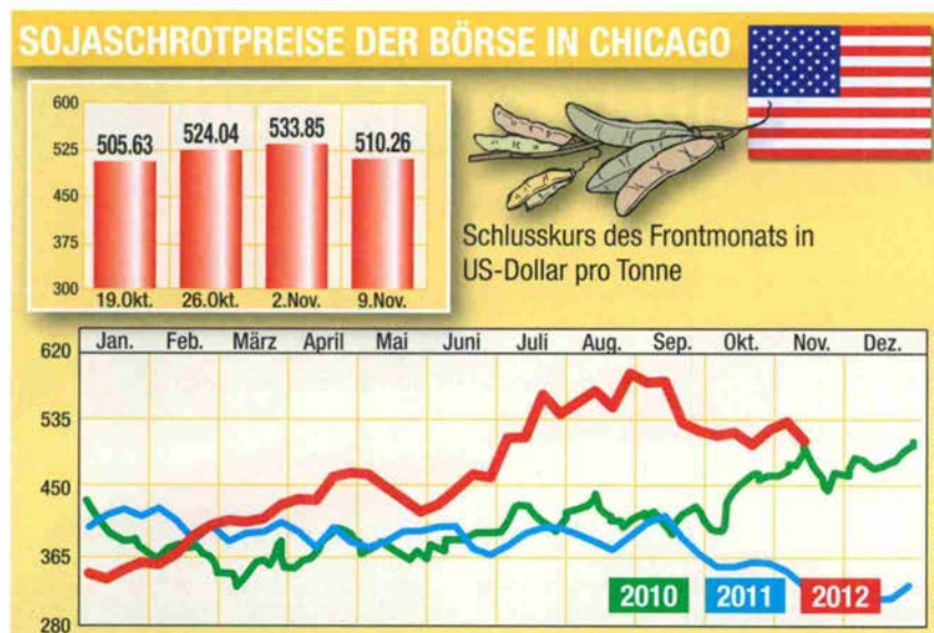
Grafik: Aktuelle Entwicklung des Sojaschrot-Preises auf dem Weltmarkt

Wie wettbewerbsfähig Alternativen zum Import-Soja sind, hängt von dessen Weltmarktpreis ab: Ist der Importpreis für Soja tief, können sich die in der Regel teureren alternativen Produkte schwer auf dem Markt behaupten. Und wenn sich der Einsatz alternativer bzw. einheimischer Proteinquellen lohnt, bedeutet dies gleichzeitig höhere Futtermittelkosten – eine Tatsache, auf die man sich wohl so oder so längerfristig einstellen muss. ■