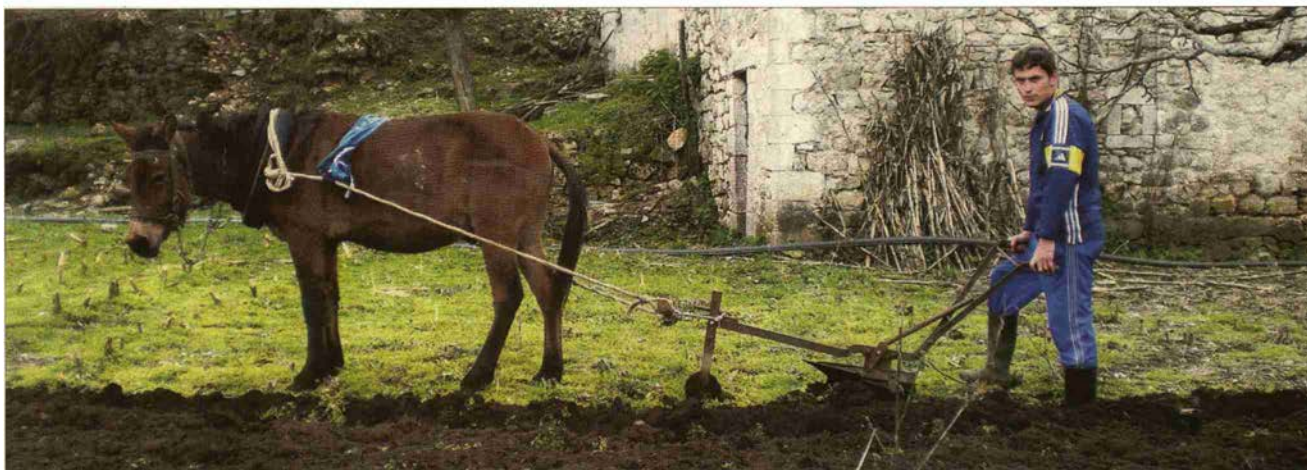
Albaniens Bauern besitzen überwiegend kleine Flächen, die sie meist auf traditionelle Weise, etwa mit Pferden, bearbeiten. Geld für Traktoren besitzt kaum jemand.