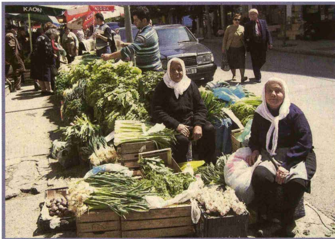
Ein Blick auf einen Gemüsemarkt in der albanischen Hauptstadt Tirana. Hier werden die verschiedensten Waren feilgeboten.