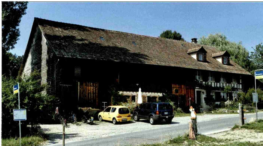
Der Binzenloh Hof wird bereits erfolgreich biologisch geführt.

Durch die Förderung des Biolandbaus nutzt die Stadt Winterthur einen für Gemeinden wichtigen Hebel zur Förderung einer umweltfreundlicheren Landwirtschaft und zur Senkung der Umweltauswirkungen der Nahrungsmittelproduktion. Wie wichtig dies ist, zeigt eine Studie des Bundesamtes für Umwelt (Bafu) von 2011, der zufolge knapp ein Drittel der durch den privaten Konsum verursachten Umweltbelastungen in der Schweiz auf die Bereitstellung, Verteilung und Zubereitung von Nahrungsmitteln entfällt.