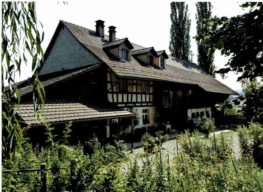
Winterthur fördert den Biolandbau und leistet so einen Beitrag zur Reduktion der Umweltauswirkungen der Nahrungsmittelproduktion.

politik besonders wichtig. Die Umstellung auf Biolandbau sei nur dann sinnvoll und möglich, wenn die Pächterfamilien mitziehen und die wirtschaftlichen Bedingungen des jeweiligen Betriebszweiges stimmen respektive ein Absatzmarkt für die Bioprodukte vorhanden ist.