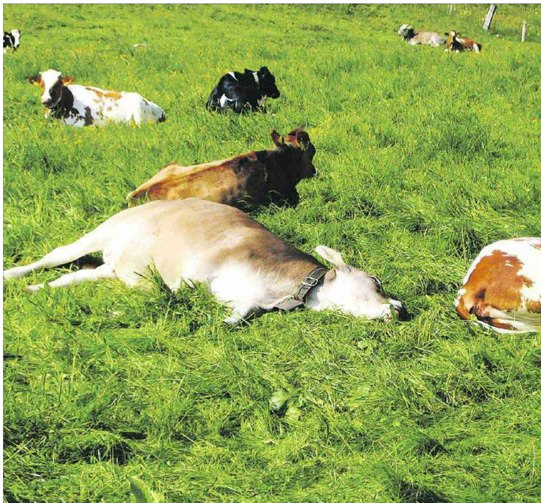
Erst im Alter von fünf Monaten kommen die Kälber als Bioremonten auf einen Weidemastbetrieb. Das hat den Vorteil, dass das Immunsystem der Tiere schon sehr stabil ist.