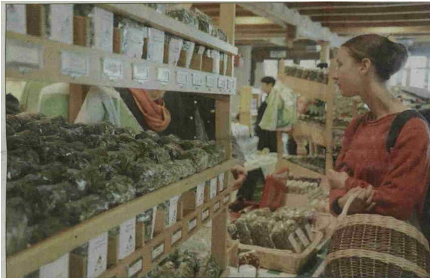
Grosse Auswahl